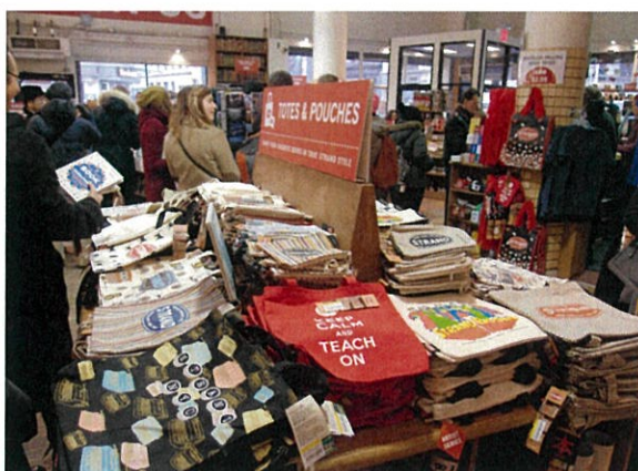
(ストランドブックストア)