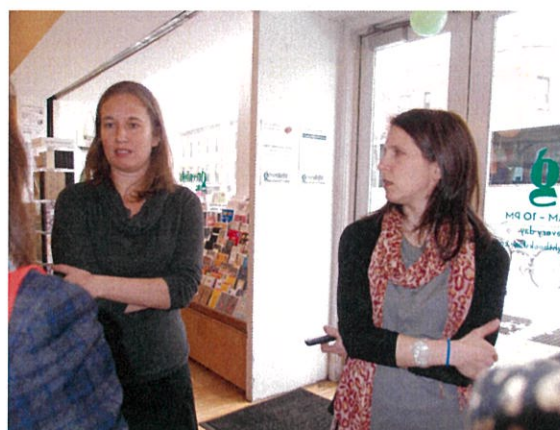
(グリーンライトブックストア)

2004 年に創業したソーホー地区のマクナリー・ジャクソン・ブックストアは、アメリカでも最も成功した独立系書店の一つといわれ、プリント・オンデマンド(POD)の制作システム「エスプレッソ・ブック・マシーン」を導入し、成功していることでも知られています。