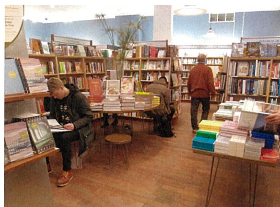
(マクナリー・ジャクソン・ブックストア)